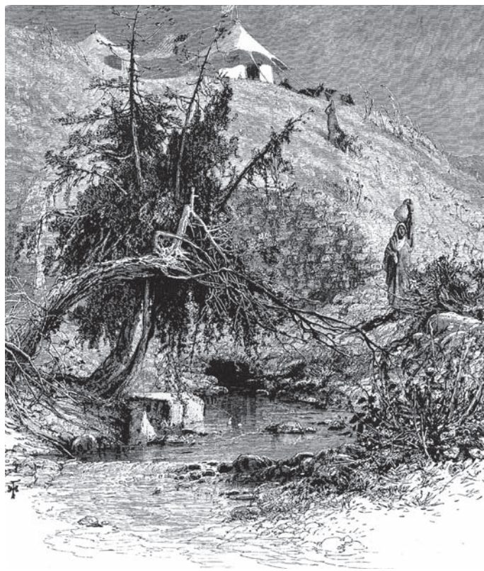
Jericho: Die Eliasquelle – auf arabisch Ain es-Sultan genannt

Der Reisende beschrieb auch Pflanzungen von Mais, Hirse, Indigo und Baumwolle, wohingegen er das Zuckerrohr vermißte, das hier früher angebaut worden sein soll. Die Landwirtschaft werde aber von »den Leuten von Taiyi-