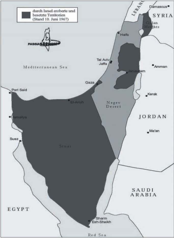
Karte 3: Der Nahe Osten nach dem Krieg vom Juni 1967

[...] um den Hals Israels sehr schnell zuzog“. (1977: 632) Weiter weist er nicht nur auf Israels Motivation hin, die Syrer dazu zu bringen, ihre Bombardements israelischer Siedlungen in der entmilitarisierten Zone zwischen Israel und Syrien einzustellen, sondern auch auf die Guerilla-Angriffe, bei denen die Angreifer bis auf israelischen Boden vordrangen. Eine weitere gern angeführte Rechtfertigung für den Angriff Israels auf Ägypten ist die Entscheidung der Ägypter, die Straße von Tiran und damit den Zugang zum israelischen Hafen Elat zu blockieren. Laut Aussage des israelischen Außenministers Abba Eban war dies „ein Versuch zur Strangulation“, der einen „kriegerischen Akt“ darstellte. (Eban, 1992: 374; zitiert in Finkelstein, 2001: 137)